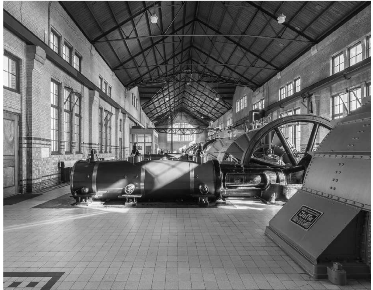
Ir. D.F. Woudagemaal • foto: Wouter van der Sar, Rijksdienst voor het Cultureel Erfgoed

Het kabinet heeft niet alleen oog voor de waarde van erfgoed, het investeert er ook flink in: de komende jaren is er € 325 miljoen extra beschikbaar. In de brief Cultuur in een open samenleving heeft het kabinet de plannen uit het regeerakkoord uitgewerkt. 1 De nu voorliggende brief gaat specifiek in op het erfgoedbeleid. De nadruk ligt hierbij op instandhouding en herbestemming, de leefomgeving en de verbindende kracht van erfgoed.