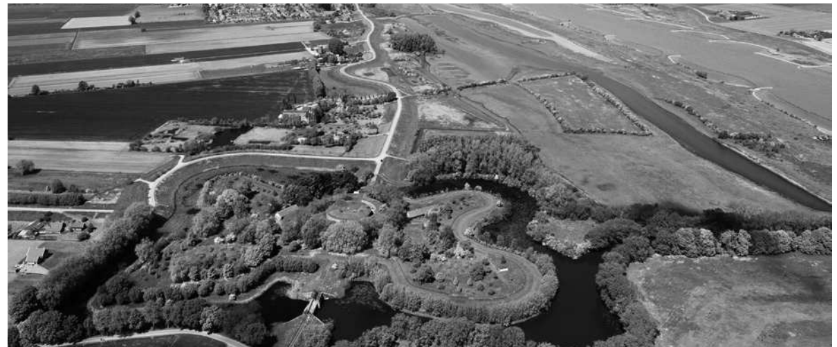
Stelling van Honswijk • foto: Siebe Swart, Rijksdienst voor het Cultureel Erfgoed

Ook de Raad voor Cultuur en de Raad voor leefomgeving en infrastructuur adviseren om meer verbindingen te leggen tussen erfgoed en de veranderingen in onze leefomgeving. Dit vraagt om betrokkenheid van erfgoedorganisaties en om het leggen van verbindingen. Het kabinet heeft hiertoe al een stap gezet door, samen met 26 andere partijen, de Green Deal Participatie van de omgeving bij energieprojecten te ondertekenen. Deze deal heeft als doel inwoners van een gebied en belanghebbenden te betrekken bij onder meer zonne- en windenergie. 10 Opgedane kennis en ervaring uit de Visie Erfgoed en Ruimte over erfgoed, participatie en inpassing worden daarbij actief gedeeld en benut.