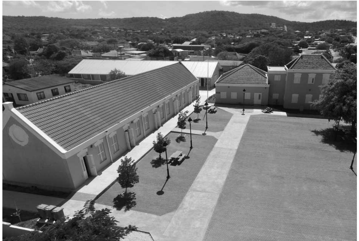
Cocari-complex Bonaire

Tot het erfgoed in Nederland behoren ook gebouwen, monumenten, plekken en objecten die te maken hebben met de joodse cultuur, religie en geschiedenis: van een kleine dorpsjoesel of een vergeten begraafplaats tot bekendere plaatsen als het Spinozahuis en het Anne Frank Huis. Joodse begraafplaatsen zijn als rijksmonument beschermd, net als synagogen, de Hollandse Schouwburg en het Anne Frank Huis. Uw Kamer heeft het kabinet verzocht om bijzondere aandacht voor dit erfgoed. 8 Het kabinet erkent het belang van dit erfgoed, ook omdat deze plekken vaak verbonden zijn met een krachtige waarschuwing voor het heden en een boodschap voor de toekomst. Het kabinet ziet er op toe dat in de uitvoering van verschillende regelingen aandacht aan het Joods erfgoed wordt besteed.