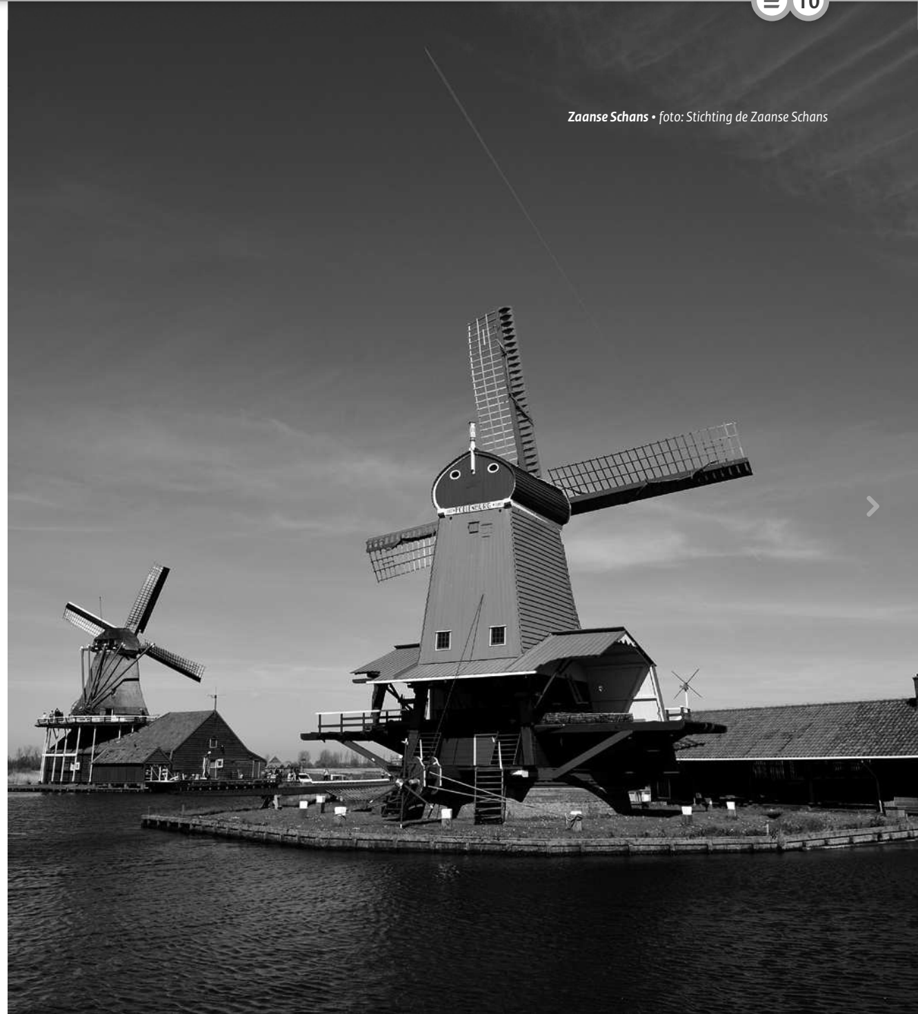
Zaanse Schans • foto: Stichting de Zaanse Schans